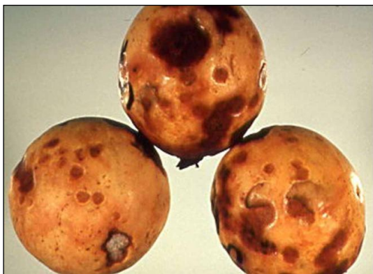
شکل ۱- علائم بیماری آنتراکنوز

در بعضی از پوسیدگی‌ها مانند آنتراکنوز و فیتوفترا عامل بیماری‌زا به میوه در حال نمو در باغ نفوذ می‌کند ولی در حالت خفته تا زمان برداشت میوه باقی می‌ماند. شدت پوسیدگی‌های میوه با تغییراتی همانند افزایش میزان قندها (منبع غذایی عامل بیماری‌زا) و کاهش فنول‌ها (ایجادکننده مقاومت در برابر عوامل بیماری‌زا) و نرم شدن میوه همراه می‌باشند (۱۸).